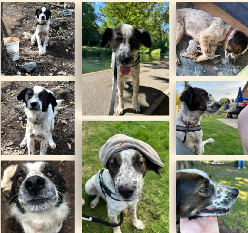
From a life on a chain to a happy life in the UK

Jo war gerade in Großbritannien und konnte sie alle treffen und im örtlichen Park spazieren gehen. Es war ein emotionaler, aber wundervoller Tag.